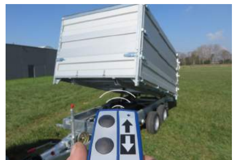
Afstandbediening voor kippen en kantelen.

(1) Enkel leverbaar in combinatie met optie voorkant MODULA