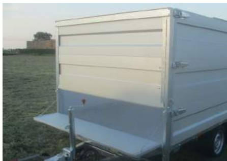
MODULA - Dubbele rij: Neerklapbaar voorbord, uitschuifbare opzetborden (H=2x50cm)