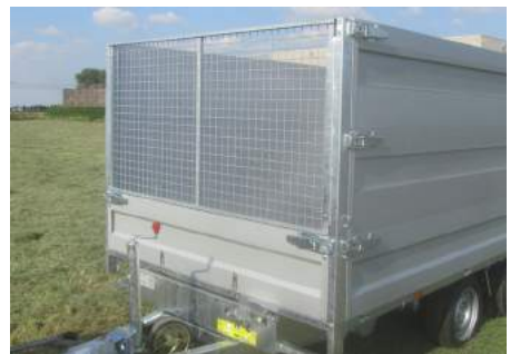
MODULA - Loofrek: Neerklapbaar voorbord, demonteerbaar loofrek (H=100cm)