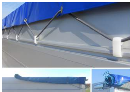
Versterkt zeil/gaasnet met oprolhulp en opbergplaats (2)