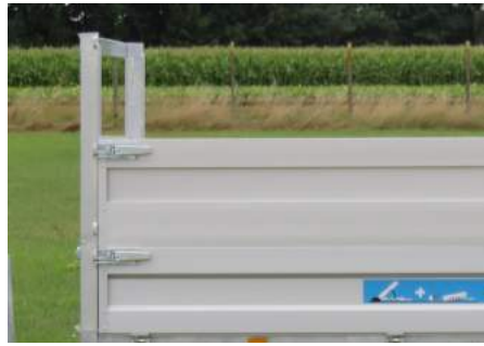
Enkele rij opzetborden (H = 50cm)