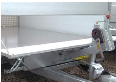
Manuele lier met steun op voorzijde (1)