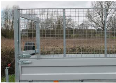
Loofrek (H = 100cm)