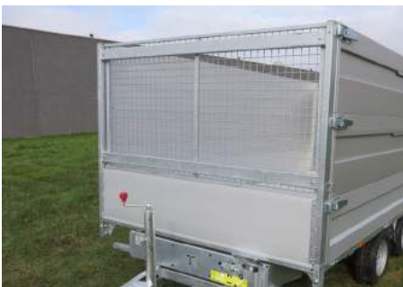
Loofrek op standaard voorrek (H = 100cm)