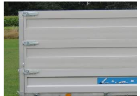
Dubbele rij opzetborden (H = 2x50cm)