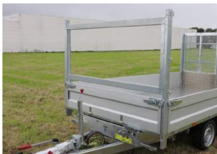
MODULA - Basis: Neerklapbaar voorbord, voorrek met verstelbare liggers