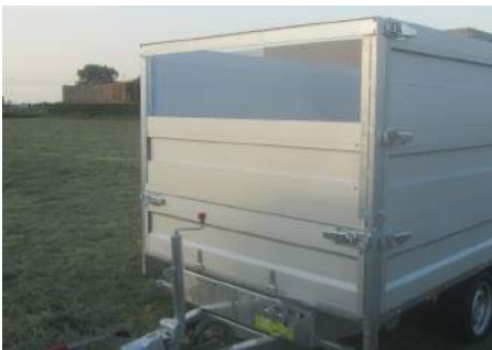
MODULA - Enkele rij: Neerklapbaar voorbord, uitschuifbaar opzetbord (H=50cm)